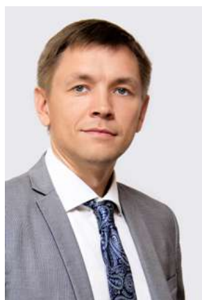
Носков Константин Юрьевич

Министр науки и высшего образования Российской Федерации