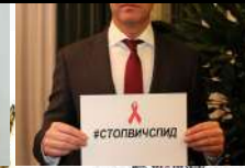
МИНИСТЕРСТВО ОБОРОНЫ РОССИЙСКОЙ ФЕДЕРАЦИИ